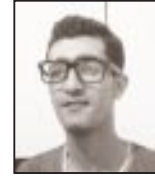
يقلم: تور الدين مباركي

ما يتناسب معه، أو عن طريق تكيف نفسه مع الموقف. حيث يتم تطوير المهارات بشكل أساسي من خلال إدارة المواقف الأكثر تنوعاً والأكثر تعقيداً.