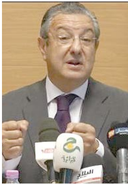
لترطهم في قضايا الفساد.

قررت القيادة العليا للجيش الوطني الشعبي، بالتنسيق مع مصالح الوزير الأول، وضع ست (6) طائرات عسكرية تحت تصرف المناصرين الجزائريين الراغبين في التنقل إلى العاصمة المصرية، القاهرة، لتشجيع ودعم الفريق الوطني القديم إثر تأهله إلى الدور نصف النهائي لكأس أمم إفريقيا، حسب ما افاد به أسس السبت بيان وزارة الدفاع الوطني.