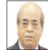
يقلم: رشيد حسن

المنطقية.. هي دولة جارة للدول العربية.. وعليه يجب أن تتبدل علاقات العداة مع هذا الكيان العنصري الغاصب الدخيل، إلى علاقات طوبىيية دائمة.. شأنها شأن أية علاقات مع دول الجوار الصديقة الأخرى.. ومن هنا.. تنشأ مستقبلًا، كفضيلة بالحل عن طريق الحوار.. والحوار فقط لا غير..!!