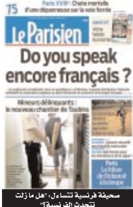
صحيفة فرنسية تتساءل: "هل ما زلت تتحدث الفرنسية؟"

تأسسها. وعن علاقة قرار استحداث هذه المصلحة بفتح العدالة لملفات فساد العديد من الإطارات السامية في الدولة، قال شريف: "في تصريح لموقع "سبق برس"، اليوم: «هناك رؤية استراتيجية من قبل رئيس أركان الجيش بحماية الشعب منذ حوالي سنة تقضي بمحاربة الفساد، الإهراق والجريمة المنظمة، حيث رأينا وقتها كيف أنه تم إحالة العديد من الضباط والأوية على العدالة بتهم الفساد والثراء بغير وجه، وأضاف في ذات الصدد: «كان يجب تعزيز الضبطية العسكرية بهذه المصلحة، لأن الضبطية الدرك عقب فتحها لمفلات