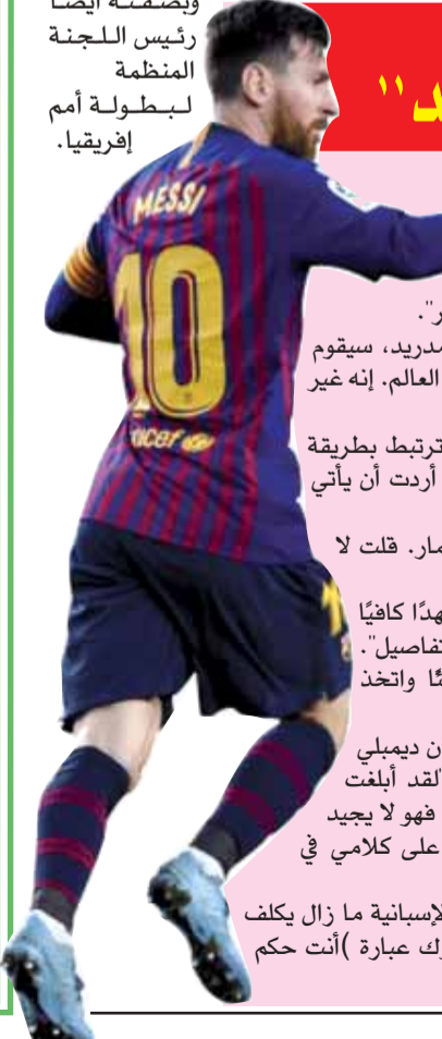
ليونيل ميسي، نجم برشلونة، يتحدث في مؤتمر صحفي بعد المباراة.