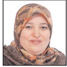
بقلم: الدكتورة سميرة بيطام*

مقاس المصالح الغربية أو المعادية لمبادئ العروبة والإسلام .