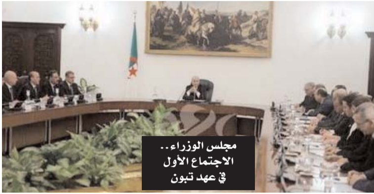
مجلس الوزراء الاجتماع الاول في عهد تبون

الرئيس مخاطبا الوزراء: "كونوا الأذن الصاغية لانشغالات المواطنين" • تبون: "ينبغي إجراء تعديل عميق على الدستور"