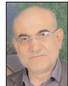
بقلم: ياسر الزحارة

فبعد وضع ميميز لإيران في الإقليم، جاء العبث الطائفي في العراق، ثم التدخل في سوريا واليمن، ليضع إيران في مربع العداء مع الغالبية في المنطقة، ثم اكتملت الكارثة بحماية طبقة سياسية فاسدة في العراق، جعلت شيعة العراق ينتفضون ضد إيران، وهو أمر بالغ الأهمية في السياق المتعلق بمشروع التمدد. ثم جاءت انتفاضة الشعب اللبناني لتضيف مازقاً لأهم فروع المشروع