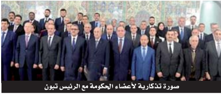
صورة تذكارية لأعضاء الحكومة مع الرئيس تبون

رسم رئيس الجمهورية، القائد الأعلى للقوات المسلحة، وزير الدفاع الوطني، عبد المجيد تبون، أمس، خارطة طريق الحكومة، واستغل لقاءه الأول بوزرائها، بمناسبة أول اجتماع لمجلس الوزراء في عهده، ليوجه تعليمات صارمة للوزراء ترمي، في المقام الأول إلى الاستجابة لانشغالات المواطنين، مشيراً - من جانب آخر - إلى أن بناء الجمهورية الجديدة يستلزم "إعادة النظر في منظومة الحكم من خلال إجراء تعديل عميق على الدستور".