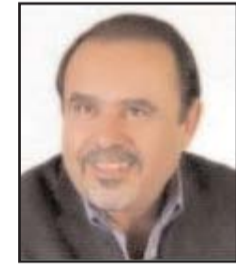
بقلم: عريب الرتاوي

الدول المؤسسة للسوق العالمي الواحد والتجارة الحرة، هي ذاتها، أول من شرع في فرض القيود والتعرفات واستخدام الأدوات الضريبية والجمركية لحماية إنتاجها... هي ذاتها الدول التي فكلت كما لم يحدث من قبل في التاريخ، "سلاح العقوبات" بوصفه أداة لضبط موازين تجارتها الخارجية. "المواطن المعولم" الذي يرتدي الملابس ذاتها، ويأكل الطعام ذاته، ويحسني الشرب ذاته، ويدخن السجائر ذاتها، ويستخدم الهواتف والأجهزة التي تصنعها حفنة من الشركات ذاتها، بدأ يرتد إلى هويته الثانية... نزعات انفصالية تجتاح دولاً