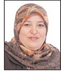
بقلم: الدكتورة سميرة بيطام*

يبدو أن فيروس كورونا يكشف الكثير من المستور ويعطي الإشارات والدلائل على مستوى كل دولة في مواجهتها مواجهة علمية بالدرجة الأولى وشرعية بالدرجة الثانية بالنسبة للدول المسلمة لهذا الفايروس القاتل ولعل حالة التأهب التي عرفتها الدول الأكثر تضررا تعطي إشارات بتغيير في العامل ككل وليسفي تلك الدولة فقط لأن العالم يتواصل بقاراته ودوله وسكانه.