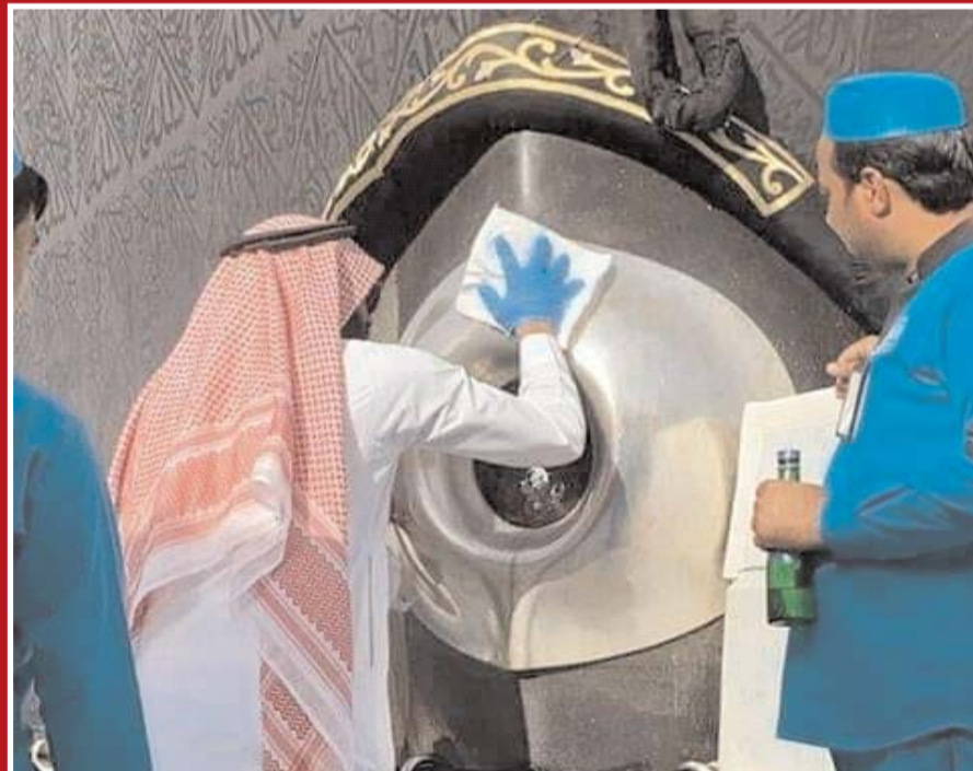
صورة من المسجد الحرام في زمن كورونا.. تطهير وتطبيب الحجر الأسود