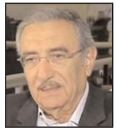
بقلم: مثير شقيق

لا من الناحية العسكرية، ولا من ناحية التهيئة الاستراتيجية والتكتيكية لها، لا سيما من جهة بناء التحالفات وتحضير الجبهات، الأمر الذي يطرح السؤال، هل ستبدأ بعد كورونا مرحلة التهيئة الاستراتيجية والتكتيكية من ناحية بناء الأحلاف وتحضير الجبهات، أم ستستمر على سمة صراع ملاكبين على حلبة في ظل قطبية متعددة تتسم بالسيولة والفضوى وازدواجية العلاقات؟ بالنسبة إلى هذا التساؤل فإن دونالد ترامب هو المسؤول عنه، وقد كان من المولعين بالملاكمة، ويقال إنه رعى بعض مبارياتها. طبعاً يفترض ألا تكون لهذا علاقة بإدارته الصراع مع الصين، لأن له علاقة بسياسات ترامب العامة التي راحت تشتبك مع ألمانيا وفرنسا وحتى بريطانيا، في موضوع المشاركة المالية المرهقة في حلف الناتو، مما يتطلب المن بموازنات الدول الثلاث، مقابل ما تقدمه أمريكا من حماية لأوروبا. وهو ما طبقه فيحفظاً، أيضاً، مع المملكة السعودية، إذ راح يبتزها مالياً ابتزازاً فاضحاً، مقابل ما يدعيه من حماية أمريكا لها. وهو ما فعله، بصورة أقل فحفظاً مع دول الخليج ومع كل حلفاء أمريكا سابقاً. وهو ما فعله أيضاً بالتعامل المالي الأمريكي مع المؤسسات الدولية، وهيئة الأمم من حيث تخفيض المساهمة المالية الأمريكية، أو سحبها كلياً، كما فعل مؤخراً مع منظمة الصحة العالمية. أراد ترامب من ذلك كله أن يحسن الوضع الاقتصادي الداخلي الأمريكي، ليخدم هدفه الأول المتمثل بإعادة انتخابه رئيساً مرة أخرى في الانتخابات الرئاسية الأمريكية في خريف 2020.