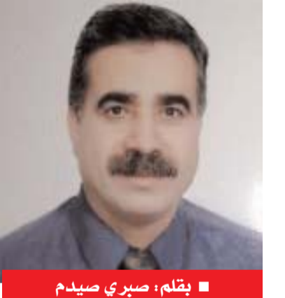
بقلم: صبري صيدم

هذا العالم الذي وقيل كورونا عانى فيه وحسب أرقام اليونسكو، 53 من أطفال الدول متدنية ومتوسطة الدخل ممن هم دون العاشرة من العمر من عدم القدرة السوية على القراءة، بينما عانى من 63 _ 50 من معلميه من نقص التدريب، في حين انضقت واحدة من كل أربع دول في العالم من ميزانياتها ما هو أقل من الحد الأدنى المطلوب للتعليم أي ما هو أقل من 15 من تلك الميزانيات. عليه ومع أزمة وباء كورونا فإن واقع التعليم عالميا مرشح أن يصبح أكثر اعتلالا خاصة وأن الصورة لم تكن أصلا مشرقة دوليا ما قبل الأزمة الأخيرة بفعل الفقر والحروب والهجرات، فما بالكم عندما يضاف إلى ذلك فقدان ترليون حصة تعليمية حول العالم واحتمالية إعادة جدولة موارد الدول وأولوياتها بعد الأزمة بشكل يعكس سلبا على التعليم. ولذلك فقد ارتأت مجموعة من 26 وزيرا من