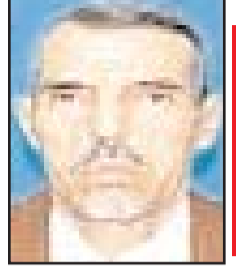
بقلم: الطيب بن إبراهيم