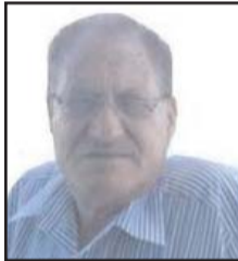
■ بقلم: رشيد حسن