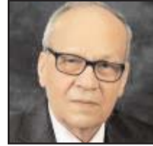
■ بقلم: عادل سليمان

غزيرة، وتعرضت الأمة لهزائم عسكرية مرّوعة، لعل أهمها، والتي لا زالت آثارها باقية، هزيمة جوان 1967، والتي حولت شعار "تحرير فلسطين" إلى شعار "إزالة آثار العدوان". ثم جاءت حرب أكتوبر 1973، والتي أعادت إلى مصر سيناء، ولكنها حولت شعار القضية، مرة أخرى، من "إزالة آثار العدوان" إلى إطلاق "عملية السلام" مع إسرائيل. في هذا المناخ، طرح الرئيس الأميركي، ترمب، "صفقة القرن" لتصفية القضية الفلسطينية تماماً، وأيضاً. وليس المقام هنا الحديث عن تفاصيل الصفقة ومحتواها، وإنما ردود الفعل العربية، والتي كانت ترفع يوماً شعار "تحرير فلسطين"، وعندما خفضت من سقف المطالب، رفعت شعار "إزالة آثار العدوان". للأسف، جاءت بعض ردود الفعل العربية متسقة مع ما طرحه ترمب. أما بشأن ما تبقى من القضية الفلسطينية، لم يعد متبقياً من تلك القضية سوى اسمها، وحتى الاسم هناك هجمة إعلامية شرسة، عبر أعمال درامية تروج التطبيع مع إسرائيل، وتسمى إلى تقييب الوعي العربي عمّا تعرّضت له فلسطين الأرض والشعب والهوية، فلسطين الوطن، من جريمة إنسانية واحتلال استيطاني بشع. إذا كان ذلك ما تبقى من فلسطين، ومن القضية الفلسطينية، بشكل مادي، على الأرض، فإن هناك ما هو أهم، وأن الشعب الفلسطيني باق، وفي كل مكان، ويملك الإيمان العميق بحقه في الأرض وفي الوطن، ويملك إرادة المقاومة.