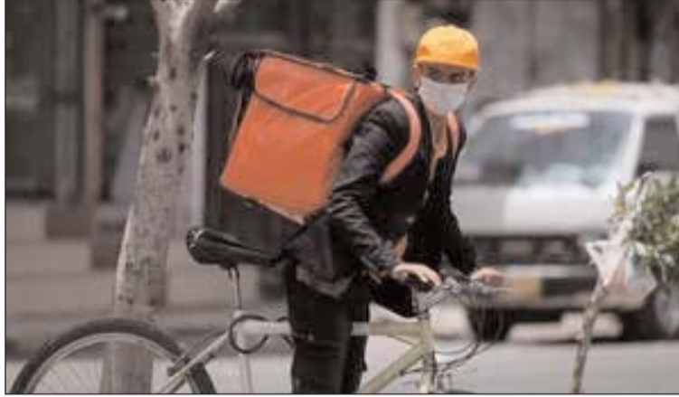
الحجر الشامل تدريجيا.

أعلنت دول أوروبية وعربية إجراءات وخططا للتعامل مع المرحلة المقبلة من أزمة وباء كورونا، في الوقت الذي وجهت فيه الأمم المتحدة نداء لجمع تمويل إضافي لحماية الدول الضعيفة من تداعيات الوباء.