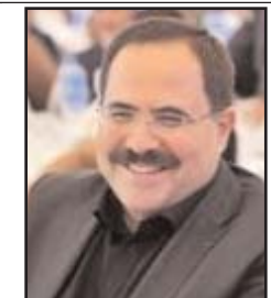
■ بقلم: صبري صيدم

وإثر ملله المطبق من وسائل الإعلام التقليدية، وما طرحه من لغة خطابية متكسفة وتمجيد للزعماء، توجه العالم نحو الإعلام الاجتماعي بنهم كبير، يبحث من خلاله عن مساحة أكبر من الحرية والتعبير، من دون ضبط أو قيد. ومع تنافس الشركات على إنتاج تطبيقات متلاحقة تعود بالدخل الكبير على أصحابها، ازداد التصاق الناس بأجهزتهم بمجموع ساعات قد يصل إلى 15 ساعة يومياً، فيما أفضى إلى ولادة ما يعرف بالتحول الرقمي. ومع تنوع المنصات المختلفة ومحتوياتها وجمهورها المستهدف، فقد انضم الأطفال وكبار السن بصورة متصاعدة لتلك التطبيقات، فقلص البعض ما عرف بالهوة الرقمية وأصبحت تفاصيل الحياة مرهونة بالتكنولوجيا الحديثة. وأمام مساحات الحرية المزعومة فقد انطلق الناس في التبرع السريع بمعلومات تفصيلية عن يوميات حياتهم الشخصية، ودقائق علاقاتهم الاجتماعية وميولاتهم المختلفة بصورة سهلت للأجهزة الاستخباراتية تكوين ملفات متكاملة لجميع