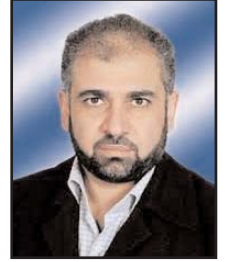
■ بقلم: الدكتور مصطفى يوسف اللدوي

النجاة، إذ لن يصبر على التيه والعمى، والعجز والشلل، وغياب الأمن وهاجس المقاومة، وسيجد نفسه مضطراً بالقيام بوظائفه كسلطة احتلال تجاه شعب يحتل أرضه، وفقاً لكل الاتفاقيات الدولية التي تحكم العلاقة بين قوى الاحتلال والشعوب الخاضعة له.