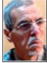
بقلم: الطيب بن إبراهيم