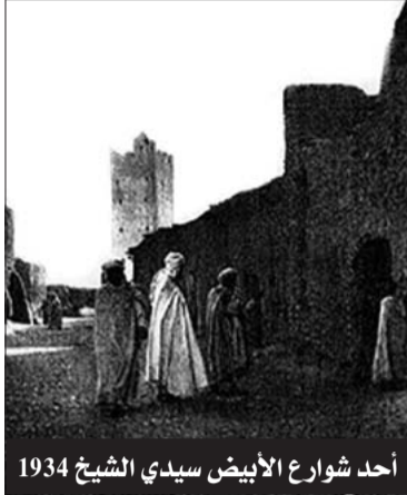
أحد شوارع الأبيض سيدي الشيخ 1934

عندما حلّ قساوسة ارسالية إخوة يسوع الصغار بالأبيض سيدي الشيخ نهاية سنة 1933، كان قد مرّ على بداية الاحتلال الفرنسي للجزائر أكثر من قرن من الزمن، وكانت الجزائر حسب تشريعات الدستور الفرنسي لسنة 1848 قد أصبحت جزء لا يتجزأ من فرنسا، وخلال هذه المدة دانت الجزائر تلا وصحراء للحكم الفرنسي، وعمت مظاهر الفقر والبؤس والجهل والتشريد ربوع الوطن، واختفت مظاهر المقاومة والسلاح، وصدقت فرنسا اسطورة الجزائر الفرنسية، ولكن النار كانت تحت الهشيم، ولم يستسلم الجزائريون ابدا، وصدقت عليهم نبوءة العالم الجزائري إسماعيل عريان، حيث