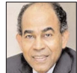
بقلم: عثمان ميرغني

الاستعمارية. وحتى لو تعذر أو رفض مطلب نقلها من مكانها، يبقى التمسك بأهمية وضع هذه اللوحات الجديدة تحتها. بهذا المعنى فإن فكرة وجود التماثيل بهدف تمجيد دورها ستتفي، ويحل مكانها تنوير الناس بشكل مستمر بتاريخ تلك الفترة المظلمة، ودور تلك الشخصيات فيها.