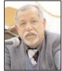
بقلم: سعيد الشهابي

ظلاماتهم التاريخية التي تحولت الى ثقافة في نفوس الاجيال المتعاقبة. ويرغم سعي الكثيرين منهم للانخراط ضمن السياقات العامة للمجتمعات الغربية، الا ان ذلك التاريخ بقي مصدر غضب لا ينتهي خصوصا في ظل تنامي المجموعات العنصرية كنتيجة للظاهرة الشعبوية التي تعم هذه الدول. هذا برغم ان السود تمازجوا كثيرا في هذه المجتمعات، ولهم حضور فاعل في فضاءات الرياضة والغناء والقطاعات العامة، خصوصا مع انتماء الكثيرين منهم للدين المسيحي. هذه الحقائق وفرت زخما لردة الفعل ازاء قتل جورج فلويد، وساهمت في فتح ملفات الماضي العنصري خصوصا في الولايات المتحدة وبريطانيا. مع ذلك تجدر الاشارة لاحتمال حدوث تداعيات اخرى لما يحدث هذه الايام من اسقاط تماثيل الشخصيات التي ارتبطت تاريخيا بتجارة العبيد والاضطهاد الاستعماري البريطاني في القرون الاخيرة. فالسياسة البريطانية معروفة بهدونها والانحناء امام العاصفة لمنع تفاقم الأزمات. هذا الانحناء يساعد قادتها لاستعادة التوازن واسترجاع المبادرة للانقضاض على ما تمخض عن العاصفة واعادة الأوضاع الى المربع الاول ربما مع تعديلات شكلية. لم تعد العنصرية التي تمارسها مجموعات اليمين المتطرف محصورة باللون، بل أصبحت تشمل ما يعتبرونه "تهديدا ثقافيا"، واصبح المستهدفون بالعنصرية ليس ذوي السحنة السوداء فحسب بل المسلمين الذين اصبحوا مستهدفين بسبب ثقافتهم وانتمائهم الديني. وهنا قد يصبح السياسي عنصريا، كما قد يكون القديس الذي يتحسس من وجود المسلمين ويعتبره خطرا على "الهوية المسيحية" للمجتمعات الغربية عنصريا ايضا. وقد يكون لهذه العنصرية مصداقية اخرى يمكن ملاحظة بعضها في سياسات الرئيس