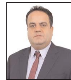
بقلم: محمد جميل