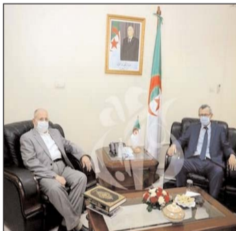
إسهامهم في تعزيز الوضع الاقتصادي والاجتماعي.

بحث وزير الاتصال، الناطق الرسمي للحكومة، عمار بلحيمر، خلال استقباله يوم الخميس بالجزائر العاصمة، رئيس المجلس الإسلامي الأعلى بوعيد الله غلام الله، سبل تعزيز التعاون المشترك بين الهيئتين "على أساس المرجعية الدينية الوطنية"، حسب ما أوردته بيان للوزارة. وأوضح ذات المصدر أن اللقاء الذي جرى بمقر الوزارة، تناول سبل تعزيز التعاون المشترك بين وزارة الاتصال والمجلس الإسلامي الأعلى، خاصة ما يتعلق بالجانب الإعلامي على أساس المرجعية الدينية الوطنية وتأييدها. كما تم بذات المناسبة، التطرق إلى أهم نشاطات المجلس ومختلف إصداراته والعمل على التعريف بها للرأي العام، وكذا دعم الجهود بين الوزارة والمجلس في تنظيم مختلف التظاهرات العلمية والإعلامية، بإشراك المجلس الإسلامي الأعلى في مختلف المناسبات والقضايا ذات الصلة بالطابع الديني باعتباره هيئة استشارية دستورية لدى رئيس الجمهورية ومؤسسة