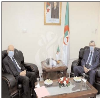
الوضع الراهن الذي تعيشه البلاد.

كما تم التطرق خلال هذا اللقاء إلى "وضعية أرباب العمل في الجزائر وبحث اليات