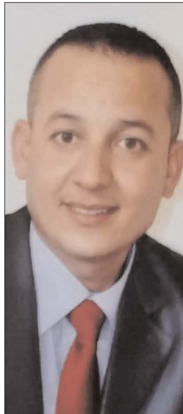
الشاعر الدكتور نبيل شريط - الجزائر

مرثية إلى كل الأطباء، الممرضين، سائقي سيارات الإسعاف، رجال الأمن والحماية المدنية، ومهندسو النظافة من المرابطين في الصفوف الأمامية لمقاومة "كوفيد 19". فُل للجناح الذي بالوصل أوصاني أهواك أمني وطير الشوق أضناني الحجر أضني غماما في ربي وجي قد ينزل الغيث من أرجاء تحنان والطير للصبح مشتاق كسوسة إن تشرق الشمس بله فوق أفئاني فديهمس الثور في أشلاء عمتنا مثل الضرب الذي تهواه عيتان في بردتي يجلس الحلاج مُتكمفا بين المقامات يغدو جل تبتاني قل لـ"كوفيد" الذي يهوي الأسي عجيلا مطاب ممشاء والأحزان تهواني طال الوباء الذي بالغدر أرقني ضيقا ثقيل على بحري وأوزاني قد تعصف الريح والغربان ترقبي بين المتايا يخيط المسك أكفاني والبين في حجرة المريض مقصلة يهي زيف الجوى في قلب خلاني استهتر القوم والأجواء مرعدة والركب تمشاء أمواج وتغشاني استفحل الداء لنا عطار يثقتني والسم يفتو خطايا خلته الجاني ما عاد بالخي ذلك العود يطرنا لأجحة اللأئسي تسي عذب الحاني هذا قريضي وصوت الأهارقه فانساقط الحرف يثلو حزن وجداني أماه لانتري دما بأشعرتي إن حل ركب الردي والصوت ناداني ذلك المباب الذي بالصبر أمخره مد زاع الوحي وأغشى الداء رباني يا من وهبت الدنيا عطفًا وأمتية إني شهيد ورب العرش سماني أماه إني دعوت الله في وجل.