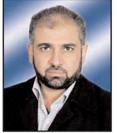
■ بقلم: مصطفى يوسف اللداوي