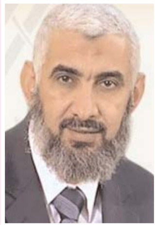
■ الشيخ راغب السرجاني

3- الهجرة كانت للجميع، وذلك على خلاف الهجرة إلى الحبشة والتي كانت