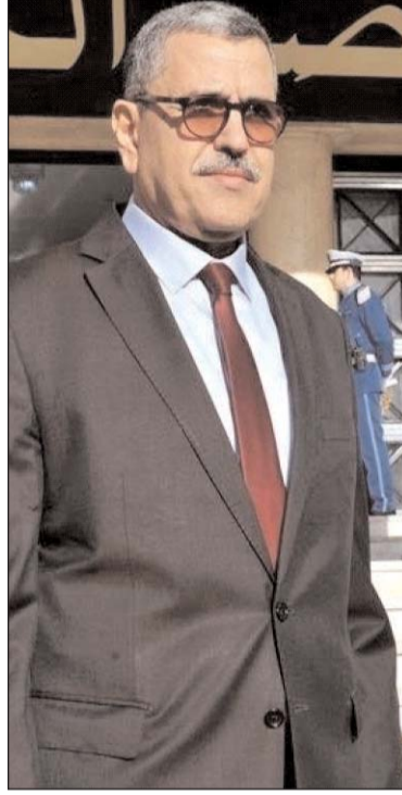
الأرصفة) وهي الظاهرة المتكررة وغير الطبيعية التي تعد أحد مظاهر التبذير".

وتمحورت أشغال الاجتماع على مدى يومين حول تقييم التنمية المحلية على مستوى مناطق الظل، الرقمنة والإحصاء ومحاربة البيروقراطية، إجراءات الوقاية من انتشار وباء كوفيد 19، وتقييم وتنفيذ الإجراءات المتعلقة بالتنمية الاقتصادية المحلية إضافة إلى الدخول الاجتماعي المقبل وأمن الأشخاص والممتلكات.