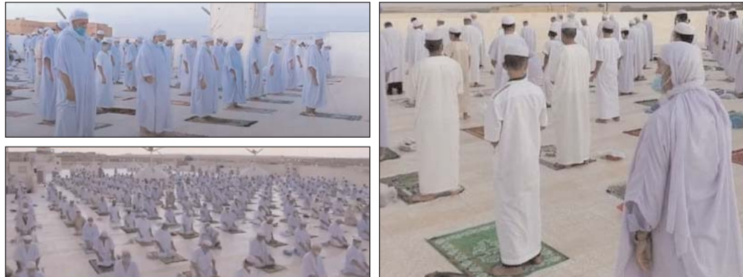
وصلت "أخبار اليوم" صور جميلة، الصور ترصد جانبا من أداء صلاة تمثل مشاهد رائعة صنعها بعض المغرب بوادي ميزاب من المسجد الكبير بمدينة القرارة (ولاية أبناء الجزائر)..