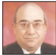
■ بقلم: داود عمر داود

كان قيام جو بايدن، المرشح الديمقراطي الرئاسي الأمريكي، بتعيين كامالا هاريس، نائبة له خطوة غاية في الذكاء السياسي، وضربة قوية أقدت الرئيس دونالد ترامب صوابه، نظراً لأن هاريس ستستقطب أصواتاً كثيرة من القاعدة الانتخابية التي اعتمد عليها ترامب، وأوصلته إلى البيت الأبيض.