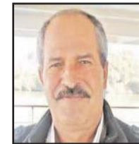
■ بقلم: سعيد الشهابي

الصراع على نفط منطقة الشرق الأوسط له عدة وجوه، تاريخية، أي منذ اكتشاف النفط في نهاية القرن التاسع عشر، وسياسية تؤكد طمع العالم في هذه السلعة الاستراتيجية التي كانت عماد المشروع الصناعي في العالم، واقتصادية بين الشركات النفطية الغربية خصوصاً الأخوات السبع: اكسون، موبيل، شيفرون، غلف أوليل، تكساكو، بي بي وشيل.