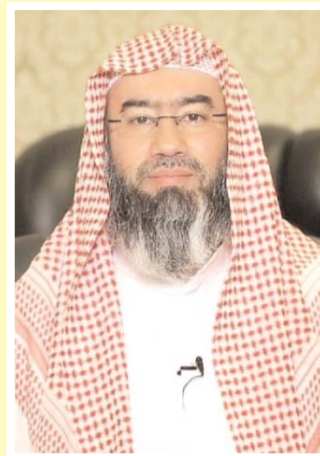
الشيخ نبيل العوضي

حديثي إليكم في هذه الجلسة هو من صلب الدين والإيمان ومن صميم العقيدة.. بل لا يتم إيمان العبد إلا بهذا الحديث الذي سوف أتكم عنه.. بتطبيق هذه المسألة من أصول الدين ألا وهي علاقتنا بالنبي محمد صلى الله عليه وعلى آله وسلم.. يقول الرب جل وعلا.. أعوذ بالله من الشيطان الرجيم ( قُلْ إِنْ كَانَ آبَاؤُكُمْ وَأَبْنَاؤُكُمْ وَإِخْوَانُكُمْ وَأَزْوَاجُكُمْ وَعَشِيرَتُكُمْ وَأَمْوَالٌ اقْتَرَفْتُمُوهَا وَتِجَارَةٌ تَخْشَوْنَ كَسَادَهَا وَمَسَاكِينُ تَرْضَوْنَهَا أَحَبَّ إِلَيْكُمْ ) هل بقي شيء من الدنيا..؟