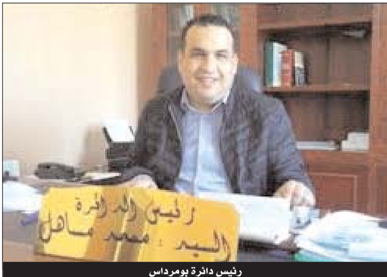
رئيس دائرة بومرداس

ويعد زيارة العديد من البلديات، قام الأمين العام للولاية بزيارة مناطق الظل على