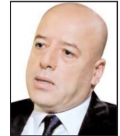
■ بقلم: موسى برهومة

من الصعب هزيمة العلم، رغم الدرس القاسي لهذا الوباء، الذي كشف هشاشة الدراسات المستقبلية حول الأخطار المحيطة بالكوكب والكانونات. ولنعترف أن الرصد الاستراتيجي كان في حالة أشبه بالفيوبية، وهذا أمر تتحمل مسؤوليته مراكز الأبحاث والجامعات والمختبرات الكبرى، وشركات الأدوية وأجهزة