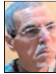
■ بقلم: الطبيب بن إبراهيم