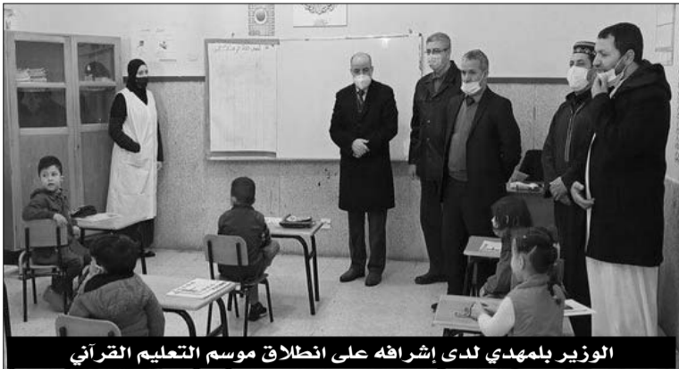
الوزير بلمهدي لدى إشرافه على انطلاق موسم التعليم القرآني

وأوضح المفتش العام بوزارة الشؤون الدينية، بزاز خميسي، أن الالتحاق بالزوايا والمدارس خلال هذه السنة سيتم بصفة تدريجية، بسبب تداعيات الأزمة الصحية التي استوجبت القيام بحملات تعقيم وتنظيف واسعة للأقسام التي ستستقبل المتدربين فضلا عن اتخاذ إجراءات تضمنها البروتوكول الصحي الخاص بمجابهة تفشي وباء كورونا. ولتطبيق هذا البروتوكول، أبرز خميسي الذي يشغل أيضا منصب رئيس لجنة متابعة فتح المساجد سيتم استغلال 50 بالمائة من طاقة الاستيعاب للمدارس القرآنية والزوايا مع الاعتماد على مبدأ تفويج الطلبة على فترات زمنية مختلفة لضمان التباعد الجسدي. وهكذا، شرع قرابة مليون شخص في الالتحاق بمقاعد الدراسة على مستوى المدارس القرآنية والزوايا بداية من أمس الاثنين على أن تستمر العملية خلال الأسبوع الجاري، وفق بروتوكول صحي "صارم" أعدته وزارة الشؤون الدينية والأوقاف لمجابهة تفشي فيروس كوفيد-19.