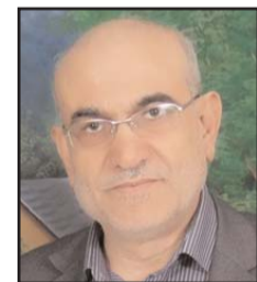
■ بقلم: ياسر الزواغرة

الخلاصة في المشهد الدولي هي الأكثر وضوحا، وتتمثل في أن الزمن لا يسير في صالح أمريكا والغرب، وأن موازين قوى جديدة تتشكل في العالم، ولن يمضي وقت طويل حتى تبدأ عملية إعادة النظر في المنظومة الدولية التي ترسخت بعد الحرب العالمية الثانية، في ذات الوقت الذي سيفرض الصراع الجديد تحالفات وتناقضات لا تتصو على مستوى العالم أجمع، لا سيما أن القوى المتصارعة ستشرع - وقد بدأت بالفعل - في تنافس محمود على استقطاب قوى أخرى لصالحها على مستوى العالم. في السياق الإقليمي، يمكن القول إن المشهد قد