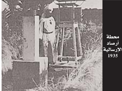
محطة أرصاد الإرسالية 1935