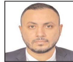
■ بقلم: عبد اللطيف خضر

فرضت الولايات المتحدة الأمريكية عقوبات على قضاة المحكمة كما هددت بمقاطعتها والحد من تمويلها، وأصدرت الدائرة التمهيدية الأولى للمحكمة الجنائية الدولية قرارها بالأغلبية أن الاختصاص الإقليمي للمحكمة في فلسطين تشمل الأراضي التي احتلتها "إسرائيل" عام 1967 (الضفة الغربية بما في ذلك القدس الشرقية وقطاع غزة). اعتبرت المحكمة حكما أن الأراضي الواقعة بين خط الهدنة والحدود الشرقية لفلسطين والتي تم احتلالها عام 1967 هي أراضي محتلة يعتبر وجود "إسرائيل" فيها وجودا فعليا لسلطة الاحتلال. مع العلم بأن المادة 42 من لائحة لاهي لسنة 1907 قد بينت المقصود بالاحتلال الحربي بأنه "اجتياز قوات أمنية أجنبية معادية إقليم دولة أخرى والسيطرة عليه سيطرة فعلية من خلال نجاحها في إنشاء وإقامة إدارة عسكرية تمارس من خلالها