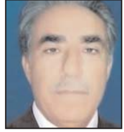
■ بقلم: مزهر الساعدي