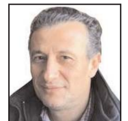
■ بقلم: إسماعيل الشريف

نظريات المؤامرة تحظى بشعبية، فالمصل سيتحكم بنا أو سيقتلنا، ولا أريد أن أعطي بيل جيتس نقودي (مع أن توزيع المصل مجاني). تحظى نظريات المؤامرة بشعبية كبيرة، وهي بالمناسبة ليست حكرا على العرب، فثالث الأمريكي يعتقدون أن الفيروس مصنع كما يكشف معهد باو للدراسات، وثالث الإنجليز لا يستبعدون أن يكون الجيل الخامس من الإنترنت هو من تسبب في المرض، لا بل إن الستين بالمائة من الإنجليز يؤمنون بنظرية مؤامرة واحدة على الأقل. لذلك فلا تلوموا أصحاب نظريات المؤامرة. في عالمنا العربي الأصل أن تكون من أصحاب النظرية، فهو أمر طبيعي في تفسير أي من الأحداث، فنحن لا نترك شيئا للصدفة،