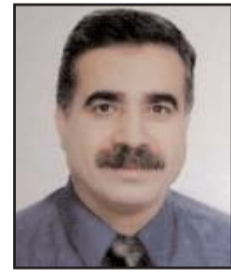
■ بقلم: نبيل الساهلي

في عام 1882 تم إنشاء ثلاث مستوطنات، هي مستوطنة ريشون ليشيون وزخرون يعقوب وروش يبننا قرب قرية الجاعونة في قضاء مدينة صفد في الجليل الفلسطيني، ثم مستوطنتي يسود همعليه وعفرون عام 1883