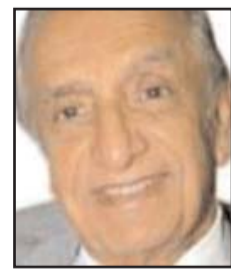
■ بقلم: علي محمد فخرو

اليوم أسأل عن الأسباب التي تمنع وجود محاولات جادة لحل الأزمة الاقتصادية والسياسية المستفحلة في لبنان، أو إنهاء الجحيم الكارثي الذي يعيشه الشعب العربي السوري الشقيق، عبر العشر سنوات الماضية، أو مواجهة الأزمات المتتالية التي تواجهها أقطار، مثل مصر أو السودان أو العراق أو ليبيا أو بعض أقطار الخليج العربي، مع أن في جميعها حكومات وقوى سياسية مدنية، قادرة على مواجهة تلك الأزمات، والسعي لتقديم حلول متوازنة معقولة. إسأل عن الأسباب لتجد أن الجواب في جميع الأحوال هو واحد: نحن بانتظار الضوء الأخضر، الذي لم يصدر بعد من هذه الدولة الخارجية المعنية، التي لها