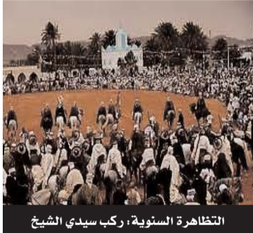
التظاهرة السنوية، ركب سيدي الشيخ

سنة، ويعتقد انه حضر مناسبة "ركب سيدي الشيخ" وهذا ما جعله يصف المدينة بـ"مكة الصغيرة". ورد هذا الوصف في إحدى رسائله التي أرسلها أثناء رحلته للأبيض، والتي سلمت فيما بعد لمجلة "الابدومادار" الفرنسية التي نشرتها سنة 1920 في عددها 34.