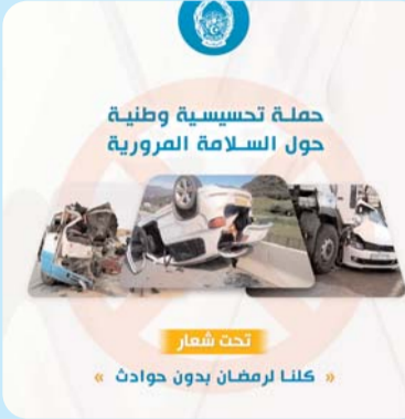
حملة تحسيسية وطنية حول السلامة المرورية