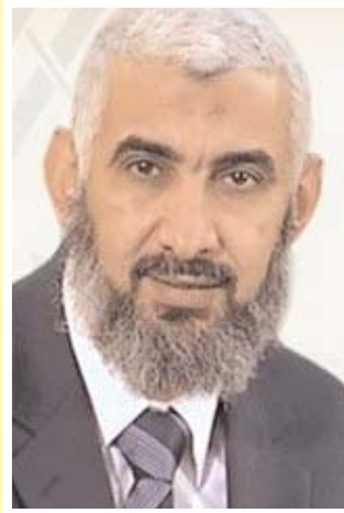
■ الشيخ راغب السرجاني

لو أني أعلم أن هذا هو رمضاني الأخير لحرصتُ على الحفاظ على صيامي من أن يُقصه شيء؛ فربُّ صائم ليس له من صيامه إلا الجوع والعطش.. بل أحسب كل لحظة من لحظاته في سبيل الله، فأنا أجاهد نفسي والشيطان والدنيا بهذا الصيام، قال رسول الله صلى الله عليه وسلم: "مَنْ صَامَ رَمَضَانَ إِيْمَانًا وَاحْتِسَابًا غُفِرَ لَهُ مَا تَقَدَّمَ مِنْ ذَنْبِهِ".