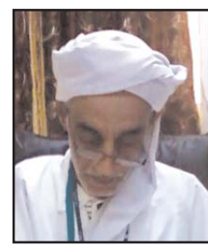
■ بقلم: الشيخ أبو إسماعيل خليفة

تعدّ الأمثال الشعبية انعكاس واقعي لمواقف مرّ بها السابقون، حيث أنهم استطاعوا ببراعتهم وإتقانهم وتمكّنهم من اللغة العربية، أن يقوموا بتحويل هذا الواقع إلى حكم وأمثال يتناقلها الأجيال، جيلاً تلو الآخر، كما أن وراء كل مثل شعبي حكاية، جعلته يترسخ في العقول الكثيرون،