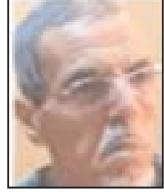
■ بقلم: الطيب بن ابراهيم

أمريكا أقوى دولة عسكرية بدون منازع، والناو أكبر حلف عسكري في العالم، وهما معا بالإضافة لدول أخرى في مواجهة طالبان منذ عشرين سنة، وطالبان ليست حلفا عسكريا، وليست دولة قائمة بكل مؤسساتها، بل هي مجرد "ميليشيا مسلحة" معارضة للدولة التي أقامها الأمريكيون وحلفاؤهم، وليست لها صواريخ ولا طائرات ولا دبابات، ومع ذلك هُزم الجمع أمامها وولوا الأديار؟! لم يكن تواجد الغزاة الأمريكيين وحلفائهم بأفغانستان مجرد تواجد قاعدة عسكرية مُقامة في أفغانستان لحراسة النظام والحفاظ على الأمن على غرار ما هو عليه الحال في البعض من بلداننا العربية، بل تواجد حربي عسكري بلغ حده الأقصى في بداية الألفية الحالية عقب أحداث 11 سبتمبر سنة 2001 . عقب أحداث 11 سبتمبر 2001، توجهت الجيوش الأمريكية إلى أفغانستان على دفعات متتالية إلى أن تجاوز عددها المائة ألف ضابط وجندي، وكانت مجهزة بأفكك أسلحة الدمار، وأكثرها تطورا للإطاحة بحكم حركة طالبان، وبعد سقوط نظام طالبان بين عشية وضحاها، لجأ مقاتلوها إلى حصونهم الطبيعية ساجبال،