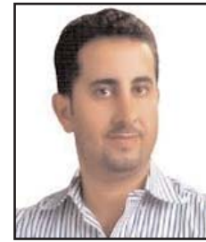
■ بقلم: خالد وويد محمود

يطالعنا المنتدى الاقتصادي العالمي الذي يعقد في دافوس سنويا بمؤشرات دولية للعديد من القطاعات والأنشطة في مختلف دول العالم من حيث مدى تقدمها أو تأخرها.