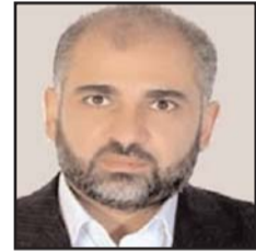
بقلم: الدكتور مصطفى يوسف اللداوي

توقفت الغارات الجوية، وعادت الطائرات الحربية الإسرائيلية إلى قواعد العسكرية، وسكنت فوهات المدافع، ونكست الدبابات مدافعها وسكنت مهاجمها، وتفرقت الحشود العسكرية الضخمة المتاخمة لقطاع غزة، وسُرح الجنود الاحتياط الذين تم استدعاؤهم، ومنحت قيادة أركان جيش العدو جنودها وضباطها اجازاتهم النظامية، ولم تعد أجواء الحرب قائمة، ولا قفزة السلاح مسموعة، بعد أن أنهى جيش العدو عملياته العسكرية الهوجاء ضد المباني والتجمعات، والمسكن والعمل والشوارع والطرق، وألحق بها وبالبنية التحتية لقطاع غزة أضرارا كبيرة، عدا عن مئات الشهداء والجرحى وجلب من المدنيين، الذين سقطوا جراء القصف الأهوج المجنون، الباحث عيبا عن هدف عسكري، والمتعشش سرايا لنصر بعيد وحسم مستحيل .