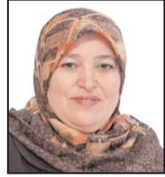
بقلم: الدكتورة سميرة بيحام

لعل الناظر والمتفحص لعنوان المقال سيبتدأ إلى ذهنه شيان اثنان :