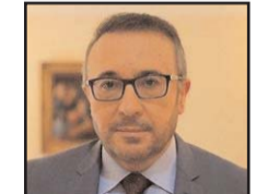
بقلم: فيصل القاسم

تقدم الحضارة الغربية نفسها للعالم منذ نشأتها على أنها ثقافة الانفتاح والانعتاق والتحرر والليبرالية والحرية بمختلف تجلياتها، فقد قدمت لنا الثقافة الأوروبية والبريطانية تحديدا مفهوم «السلطة الرابعة»، أي سلطة الإعلام التي لا تقل نفوذا وتأثيراً عن السلطات الثلاث: التنفيذية والتشريعية والقضائية، بحيث بات الغرب رمزا للتحرر الإعلامي، وقد جاءت أمريكا لتعطي زحما جديدا للفضاء الإعلامي بإطلاق مواقع التواصل قبل سنوات لتزيد من مساحة الحرية الإعلامية في العالم أجمع وتحرر الشعوب من سطوة الإعلام الموجه. لكن كثيرين في العالم أرواحا ينظرون إلى الفتنوحات الإعلامية الغربية غير المسبوقة تاريخيا بعين الشك والرفض لأنها ستقتضي على ثقافات كثيرة في العالم قائمة على الضوابط والمبادئ والعادات والتقاليد الراسخة كالحضارات الشرقية. وبالرغم من أن الموجة الإعلامية التحريكية الغربية اجتاحت العالم من أقصاه إلى أقصاه، إلا أن البعض مازال يعتبرها خطراً على البشرية بسبب تركها الحبل على الغارب لكل أنواع المنشورات الفالسة من عقائدها