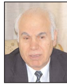
بقلم: علي غزالة عرسان

والتواطؤ وخذلان العدل والحق والقيم الأخلاقية والإنسانية، السكوت على الجرائم التي ترتكبها منذ إنشائها بالإرهاب والاحتلال والقتل والإبادة الجماعية لشعب غزة، وتزود "إسرائيل" بالسلاح والمال والدعم السياسي وتعطيها في كل عدوان لها الوقت والسند الذي تطلبه لتقوم بجرائمها.. ويأتي على رأس من يفعل ذلك الولايات المتحدة الأمريكية الدولة الراعية للعنصرية والإرهاب والعدوان الصهيوني. في عدوانها الأخير على غزة قدمت إدارة الرئيس بايدن لإسرائيل دعما عسكريا وماليا وسياسيا ودبلوماسيا وإعلاميا تحت شعار: سمن حق إسرائيل الدفاع عن نفسها؟، أعطتها ما طلبت من وقت ليقوم جيشها المجرم من الأخلاق بإبادة حلقية في مسلسل الإبادة الجماعية المنهجي المستمر ضد الفلسطينيين، وللإجرام على غزة وهدم بيوتها فوق رؤوس ساكنيها.. وقد بلغ "عدد شهداء القصف الإسرائيلي 255 شهيدا و67 طفلا و 39 امرأة وأكثر من 1948 "صاحبة"، حسب تقرير لوزارة الصحة الفلسطينية في غزة.. وقد دمر الصهاينة البنى التحتية في القطاع المحاصر من "طرق وكهرباء وشبكة مياه الشرب وشبكة الصرف الصحي وإبراجا وأبنية ومؤسسات ومستشفيات"، وقصفوا الأبراج السكنية