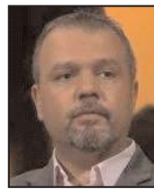
بقلم: خلدون الشيخ

متلاحقة ومنهكة، إضافة إلى أن مباريات البطولة موزعة على 11 مدينة، وليست هناك أفضلية مطلقة للمضيف، وكلها عوامل سانحة لتكون أرضا خصبة لتحقيق مفاجأة على غرار 1992 (الدنمارك) واليونان (2004)، ولهذا يمكن تقسيم المرشحين إلى أربع فئات. الأولى وهي القوى التقليدية، التي تتكون من منتخبي إيطاليا وألمانيا، وهما مهما كانت قدراتهما الحالية وحالتهم الاستعدادية، كعمانة المناشفت في الأونة الأخيرة مع المدرب يواكيم لوف، الذي منذ خيبة الحول في قاع مجموعته في الدور الأول من مونديال 2018 لم يتعاف بصورة صحيحة، بل تعرض لهزيمتين خلال الشهور الأخيرة من الأكثر ذلا في تاريخه، يخسارته امام اسبانيا 6-0 في دوري الأمم، وأمام المغفور مقدونيا الشمالية 2-1 في تصفيات كأس العالم، ومع ذلك يظل مع الأزوري الذي غاب عن مونديال 2018 لاختفائه في التأهل، من القوى العالمية التقليدية إلى جانب البرازيل والأرجنتين، ولا يمكن تهميشها في أي بطولة تشارك فيها. الفئة الثانية وهم الابطال السابقون، التي تشمل منتخبات فرنسا والبرتغال وهولندا