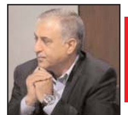
بقلم: حسين الرواشدة

قيامنا بواجبنا الذي يقتضي تقديم (ديننا) إليهم، على حقيقته، وتعريفهم به كما هو، وإزالة كل ما اعتراهم حوله من تشويه او تدليس. تسألني عن المناسبة؟ لدي صور كثيرة مفاجئة يمكن ان أسجلها للتدليل على تقصيرنا المشين بحق ديننا ورسولنا عليه السلام - وبحق الدعوة التي جعل الله تعالى امتنا بسببها (خير امة أخرجت للناس)، لكن استاذن في الإشارة إلى صورتين فقط: إحداهما التقطت في أمريكا، حيث أشار استطلاع أجراه معهد غالوب لاستطلاعات الرأي قبل سنوات، إلى ان أكثر من (63 بالمائة) من الأمريكيين يجهلون الدين الإسلامي، ومن بين هؤلاء 23 بالمائة معرفتهم معدومة تماماً بالإسلام، و(36 بالمائة) لم