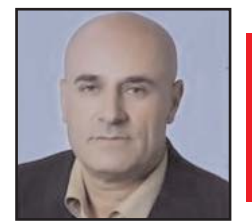
بقلم: محمد سلامة

القرن الماضي هي البداية، وتواتت نكساتنا في مواجهة نهضات إسرائيل وإيران وتركيا، على نهري دجلة والفرات، وفي فلسطين وسوريا والعراق، وفي ساحات الاشتباك الإعلامي والسياسي والامني، وصولاً إلى ما نحن فيه اليوم. سد «النكسة».. هل يوصلنا إلى سد (وقف) النكسات العربية أمام جبهات الظلام من حولنا ام نواصل مسلسل النكسات؟، فكل التوقعات تؤشر على أن إنتصار اثيوبيا في مشروعها «سد النهضة» يعني أول ما يعنيه أننا سائررون في نهضة جوارنا على حساب شعوبنا وثرواتنا وخير اتنا، وأتينا خسرتا ثروات الماء قبل ثروات الغاز والغاز،