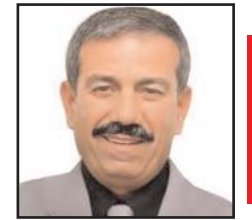
بقلم: حمادة فراعة

المختلط من أبناء المنطقتين 48 و67، محروم عليهما أن يعيشا معاً وفق القانون العنصري غير الإنساني السائد في مناطق 48 رغم أن أحدهما الزوج أو الزوجة من مناطق 48 والأخر من مناطق 67. القانون تم تشريعه عام 2003 ويُجدد سنوياً، وتم عرضه على اجتماع الكنيست الإسرائيلي يوم الأحد 2021/7/4، ولم يحظ بالأغلبية العديدة، فسقط القانون ولم يتم التجديد له، أي توقف استمراره والعمل به، بواقع 59 صوتاً للمؤيدين للقانون، و59 معارضاً له، وهكذا فشلت حكومة اليمين واليمين السياسي المتطرف برئاسة بينيت من تمرير القانون. الذين أسقطوا القانون وصوتوا ضده هم أحزاب المعارضة اليمينية برئاسة نتياهو مع الليكود وله 30 نائباً ومعهم الأحزاب الدينية الثلاثة: 1- شاس أري درعي له 9