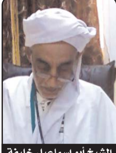
الشيخ أبو اسماعيل خليفة

فمتى نعرف كيف نفرح؟ ومتى نعود إلى عقولنا؟ ومتى يقول العلاء والزجال كلمتهم؟