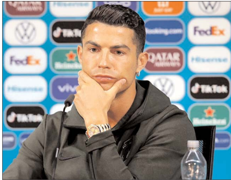
النادي المنتمي لمدينة تورينو للمرة الثانية بعد عامين من رحيله. ورجحت بعض التقارير، أن تكون عودة

يذكر أن رونالدو، انضم لجوفنتوس في العام 2018، ولعب في موسم 2019/2018 تحت قيادة أليغري، ونال في الموسم المنصرم جائزة أفضل هداف في الدوري الإيطالي، بعد تسجيله 29 هدفاً.