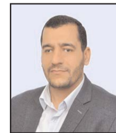
■ بقلم: محمد خير موسى

الهجرة النبوية حدثٌ غيّر وجه التاريخ دون أدنى مبالغة، ولذلك من الواجب على أهل الفكر والدعوة قراءته بعمق وتحليل تفاصيله لاستلهام الدروس ووضع الأسس التي يبنى عليها نجاح الأحداث المفصلية في واقع المسلمين الطامحين إلى الخروج من المآزق التاريخي والحضاري الذي يعيشونه.