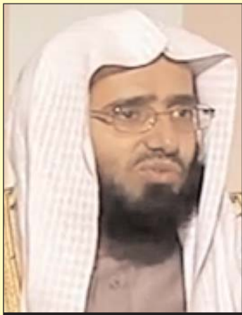
■ الشيخ عبد العزيز الفوزان

إلى أرض مصر مع أهله، وفي الطريق إليها أكرمته الله برسالته، وأوحى إليه بوحيه، وكلمه كفاحاً من غير واسطة ولا ترجمان، وأرسله إلى فرعون بالآيات القاطعات والسلطان المبين، ولكن فرعون عاند وكابر، فكذب وعصى، ثم أدبر يسعي، فحشر فنادي، فقال أنا ربكم الأعلى) وادعى أن ما جاء به موسى سحر، وأن عنده من السحر ما يبطله، وجمع السحرة من جميع أنحاء مملكته، فألقوا ما عندهم من السحر، فلما ألقوا قال موسى ما جئتم به السحر إن الله سيبيطه إن الله لا يصلح عمل المفسدين، ويحق الله الحق بكلماته ولو كره المجرمون) (فألقى موسى عصاه فإذا هي تلقف ما يأفكون) فوقع الحق وبطل ما كانوا يعملون، فغلبوا هنالك وانقلبوا صاغرين، وألقي السحرة ساجدين، قالوا آمنا برب العالمين، رب موسى وهارون.