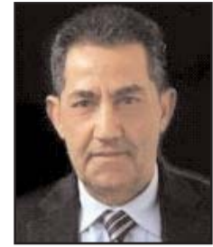
■ بقلم: عبد الحميد صيام

بعد سبعة عشر يوماً من المنافسات الرياضية الممتعة اختتمت الدورة الثانية والثلاثون للألعاب الأولمبية، التي أقيمت في طوكيو هذا العام بدل موعدها الأصلي عام 2020 بسبب جائحة كورونا. شارك في الدورة أحد عشر ألف رياضي ورياضية، تنافسوا في 339 فعالية رياضية. ضمن 33 صنفاً من الرياضة.