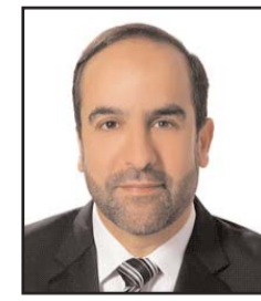
■ بقلم: عدنان حميدان

أن تكون كبيراً ومهاب الجانب وقدرك محفوظ ومحترم؛ مسألة تتجاوز أناقاة ملابسك وتسريحة شعرك، فهي تدخل في صلب طريقة تفكيرك وكيفية تعاملك مع ما يدور حولك.