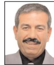
بقلم: حمادة فراجنة

قومية، مذهبية مرّضية متعددة، فقد قفز عن كافة المعطيات النازفة، ورعى مؤتمر الحوار الوطني بمشاركة مختلف المكونات العراقية، واستضاف قمة ثلاثية مع الأردن ومصر يوم 2021/6/27، وما هو يفتح بوابة كادت تكون مغلقة سيتم البناء عليها، إذا توفر لها النجاح، بدعوتها لأطراف إقليمية ودولية متصادمة، يجمعها على طاولة عراقية واحدة، ما يدل على قدرة الرجل وسعة أفقه، وتوسله للعمل من أجل خلاص العراق مما علق به من احتلالات، تدخلات إقليمية، حروب بينية، وخراب شمل خارطة العراق ودمار طغى على مؤسساته ومنشآته، لعله يُفلح في إعادة الأمل، وزرع البناء والنمو، وإزالة المعيقات نحو التطور بما يليق ببلده وشعبه.