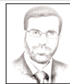
بقلم: عبد الله المجالي

إنجاز دبلوماسي ضخم حققه العراق في جمعة الأضداد في عاصمة الرشيد بغداد، وهو أمر لم يكن يتصور قبل عام على الأقل. بغداد الرشيد احتفت بحضور 9 مسؤولين رفيعي المستوى بينهم أربعة زعماء، ورئيساً