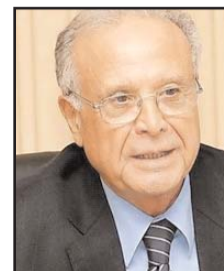
بقلم: أحمد القديدي

فيه هو كيف تتكاتف جهود الجميع من أجل إعادة العراق إلى فلك الإقليم كدولة محورية في الحفاظ على أمنها وأولاً وصيانة أمن المنطقة. وصدع أمير قطر الشيخ تميم في كلمة افتتاحية بجملته من الحقائق منها أن دولة العراق حين غيبتها سنوات التطاحن الإقليمي والدولي منذ 1990 ثم منذ 2003 عن المجهودات المشتركة للسلام والأمن فقد العالم بغياها دولة ذات تاريخ وذات أمجاد، ولديها مقدرات كبرى لخدمة غايات السلام المشترك، وقد أن الأوان لعودة العراق سليماً معافى للتعاون معنا جميعاً نحن شركاؤه وجيرانه حتى يتحقق ما نصبو إليه كلنا من وفاق وتضامن وسيادة وأمن. وقال أمير قطر: "تمر منطقتنا بتحديات وأزمات معروفة لكم، وبعض يؤر التوتر فيها تشكل تهديداً ليس فقط لشعوب المنطقة بل أيضاً للسلام والأمن الدوليين الأمر الذي يستدعي معالجة جذور القضايا التي أفضت لبروز هذه الأزمات المتتالية. وفي هذا الصدد، نؤكد على أن وحدة العراق وطننا وشعبنا وتعزيز مؤسسات الدولة الشرعية بما في ذلك وحدة السلاح الشرعي في ظل سيادة