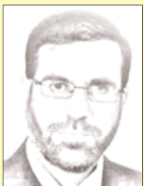
بقلم: عبد الله المجالي

لا ينطق الصهاينة بجميع مستوياتهم يعملون من أجل تهويد الأقصى والاستيلاء عليه، كل من مكانه. ليس آخر مخططاتهم، لكنه ضمن سلسلة خطوات مدروسة تشمل عليها سلطات الاحتلال بهدوء؛ مخطط يستهدف جسر باب المغاربة.