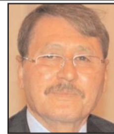
بقلم: فؤاد البصاينة

الأسقف ميشال داربيني 1957-1880 الأسقف ميشال داربيني Michel