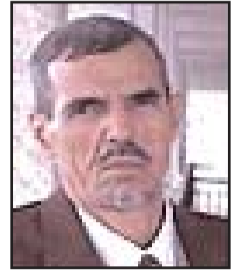
بقلم: الطيب بن ابراهيم