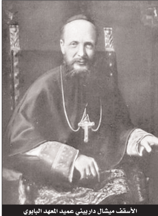
الأسقف ميشال داربيني عميد المعهد البابوي

ورفع منها النداء للصلاة "الأذان"، أرسل إليه رسالة يهنئه فيها على الخطوة الجريئة، وهي استبدال الجرس بالنداء للصلاة من أعلى المنارة قائلا له: