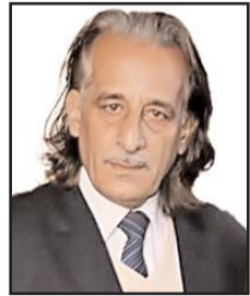
■ بقلم: محمود علي النجار

يستسلم ولا يركن إلى الانتظار، ولديه عقيدة راسخة بأن نهاية هذا الكيان قد اقتربت، وتشكل أدبيات حركة حماس جوهر هذه العقيدة، وفلسطين محاطة بالدول العربية التي لن تبقى على ما هي عليه إلى الأبد؛ فاليوم غير أمس وغدا غير اليوم، وكل المؤشرات تشي بالوعد الحق الذي يحمل معه كل عوامل النصر والتمكين..