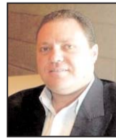
■ بقلم: سري الزودوة

وبهذا الموقف يعزز الاتحاد الأوروبي موقفه بعد اعتماد البرلمان قرار زيادة مخصصات الأونروا بأغلبية 521 صوتاً من أعضاء البرلمان مقابل معارضة 88 صوتاً وامتناع 84 عن التصويت هو تعبير حي عن التزام الاتحاد الأوروبي بإدانة دعمه السياسي والمالي للأونروا ورسالة تأكيد بالدور المهم الذي تقوم به وكالة الغوث الدولية من خلال