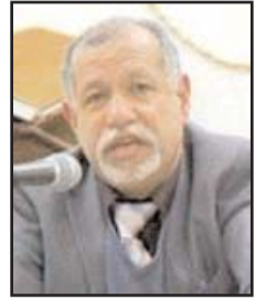
بقلم: سعيد الشهاوي

دور محوري في إقامته. وكان ذلك النظام من أسوأ ما شهدته البشرية من انتهاك إنسانية البشر، إذ تضمن كافة العناوين التي تستبطن الشتر: الإقطاع، الاستعباد، الاتجار بالبشر، التمييز العنصري، الاضطهاد العرقي، وكلها قيم مارسها الدول المذكورة التي كان لها دور في اضطهاد الشعب الفلسطيني واحتلال أرضه وتشريدته من وطنه. وكانت الثورة ضد العبودية نقطة فارقة في التاريخ البشري الحديث، لقد ساهمت مفاهيم النضال ضد الاحتلال الإسرائيلي وداعميه في تأسيس قيم الحرية والإنسانية في نفوس الكثيرين، فأصبحت ظاهرة العبودية مقبولة ومرفوضة وأدت لحدوث تمرد ضدها على نطاق واسع. هذا الاستعباد كان له مدلولات أخرى في العالم العربي، أهم ملامحها الاستبداد والديكتاتورية، فكانت فلسطين وقضيتها مصدر جذب للعناصر الراضية في الثورة على واقعها المهين. وبهذا تتجلى الظاهرة الرابعة لما تمخضت عنه قضية فلسطين. فقد أدركت الشعوب العربية تواطؤ النظام الرسمي العربي مع القوى التي أسست الاحتلال ودعمته وأعادت صياغة سياساتها الخارجية وعلاقاتها الدولية لتتنجم مع استضعاف الشعوب. فكانت الثورة الفلسطينية شوكة في خاصرة تلك الأنظمة، ورأى فيها الجيل المعاصر من المناضلين منطلقاً للنضال الوطني الهادف لتحرير البلدان من الاستبداد الذي خلق ظروف الأزمة وساهم في إضعاف الأمة وعجزها عن التصدي للاحتلال، فبقى أهل فلسطين وحدهم في الميدان. هذا الوعي الجماهيري تواصل طوال العقود السبعة الماضية ليتحول إلى حركات وثورات لم تتوقف، حتى تجسدت عملياً في ثورات الربيع العربي التي قمتها الجهات الداعمة للاحتلال أو التي طُبعت معه أو تخلت عن مسؤولياتها الأخلاقية والتاريخية تجاه أهل فلسطين.