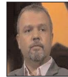
بقلم: خلدون الشيخ

في أكبر مباريات الموسم، وهي ما تم التعارف عليها بأنها نهائي الأبطال أو التشامبيونز ليغ، ستشهد الأنظار لمؤازرة السيتي بسبب وجود النجم الجزائري رياض محرز، والذي شارك في المباراة النهائية قبل عامين مع السيتي في 2021 عندما نجح النجم المغربي حكيم زياش وفريقه تشلسي في الفوز باللقب. في الواقع ظل نهائي هذه المسابقة يشهد مشاركات لنجوم العرب بشكل مستمر، حيث شارك النجم المصري محمد صلاح مع ليفربول في ثلاث مباريات نهائية أعوام 2018 و2019 والموسم الماضي، حيث فاز باللقب مرة واحدة في 2019. دائماً تكون المباريات النهائية للكؤوس الأوروبية